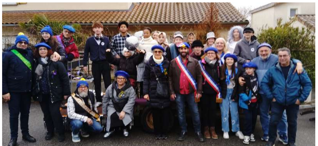
Le tableau présidentiel 2026 accompagné du Conseil des Jeunes

Date à retenir : Assemblée Générale le 17 avril à 20h30 dans la salle des associations. Venez nombreux !