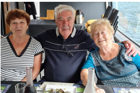
La fine équipe

Le jeudi 2 Juin, le club a fait une sortie déjeuner croisière à Saint-Victor-sur-Loire. Cette journée fut bien remplie avec un repas apprécié de tous pris à bord du bateau «Le Grangent ». La journée s'est poursuivie par une visite guidée du château de Bouthéon et du parc botanique et animalier. Cette excursion avait été organisée par les Rapid'Bleus.