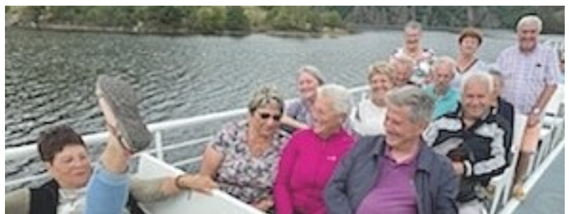
Le pied marin...

Le mercredi 15 juin, comme d'habitude au cours de cette journée conviviale, nous avons reçu les clubs de Châtillon et de Parnans pour un concours inter-clubs. Ce fut un moment de partage apprécié de tous.