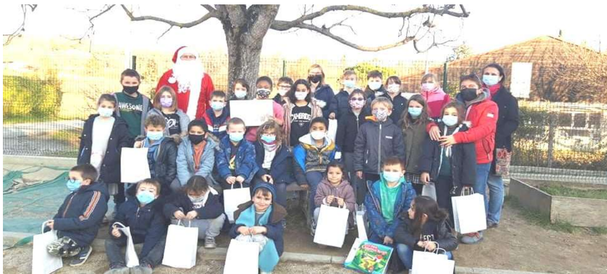
La visite du Père Noël à l'école

Nous vous donnons rendez-vous au printemps pour une nouvelle vente à emporter ainsi que le 17 juin pour la fête de la musique !