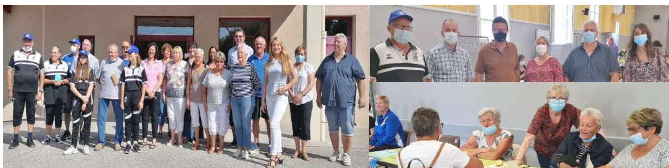
Exposants et élus présents au forum

Le samedi 4 septembre 2021, pas moins de 14 associations des villages de Parnans, Châtillon-saint-Jean et Triors étaient réunies, dans la salle polyvalente de Triors, pour proposer au public nombreux venu leur rendre visite des activités comme la danse, la pétanque, le théâtre, la musique.... Des démonstrations de pétanque étaient organisées pour donner aux plus jeunes le goût de cette activité. On notait la présence de représentants des clubs des Anciens, très impliqués.