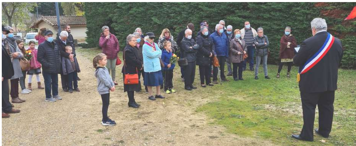
Recueillement lors de la cérémonie